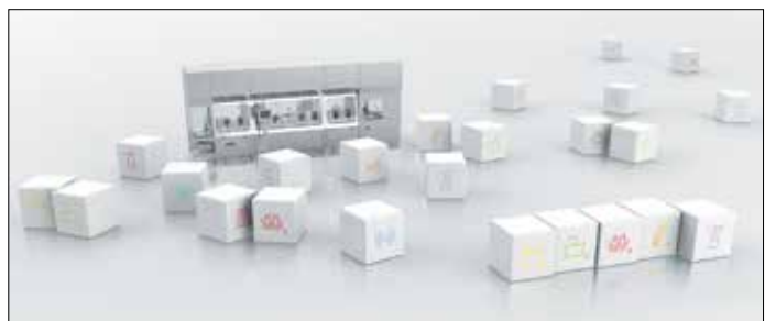
Модульные линии groninger на примере новой серии машин «Business Line»

торами продолжительность цикла деконтаминации уменьшена приблизительно на 50% благодаря новейшей разработке системы прямого распыления перекиси водорода.