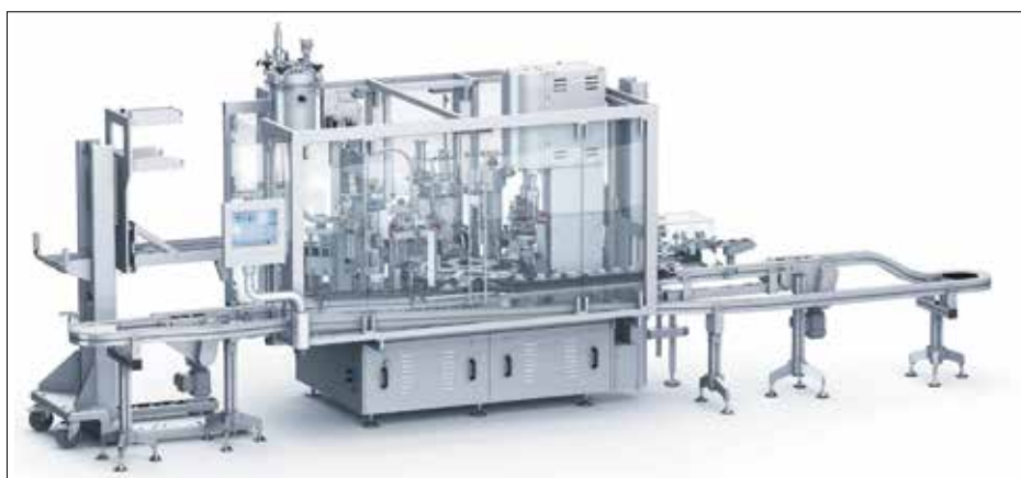
Надежные технологии для косметической промышленности на примере машины groninger Crème 60