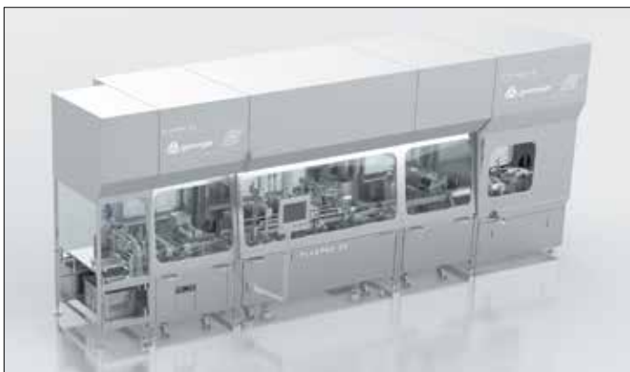
Groninger FlexPro 50 - модульная, универсальная линия с очень коротким сроком поставки.