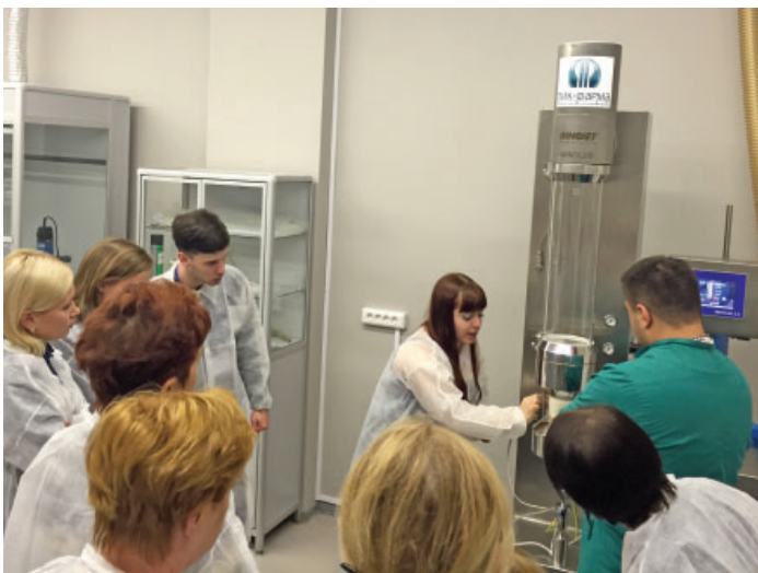
Процесс нанесения пленочного покрытия VIVACOAT на МКЦ сферы

ООО «Реттенмайер Рус» является филиалом немецкого концерна JRS® PHARMA , начало свою деятельность на территории России и стран СНГ в 2005 году. JRS® – это немецкое семейное предприятие, появившееся в 1877 г. в Розенберге, как обоянная лесопилка. Сегодня JRS® обладает 33 заводами по всему миру и ведет 12 направлений бизнеса, важнейшим из которых является фармацевтика ( JRS® PHARMA ).