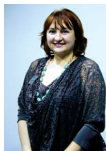
Е. Анисимова «Arjohuntleigh», Gefinge group