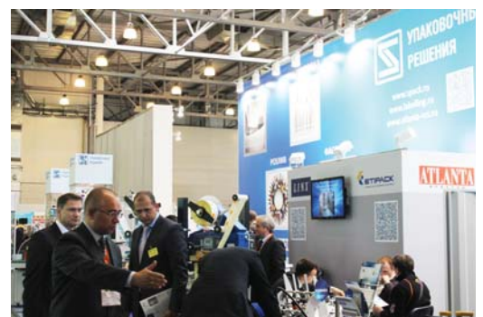
на стенде «Упаковочные решения»