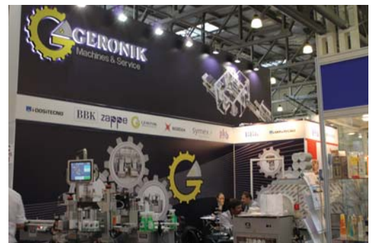
на стенде «Geronik»