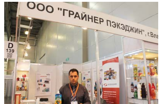
Л. Малыгин, «Грайнер Пэкэджин»