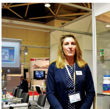
О. Биндер, «BB Verpackungsmaschinen»