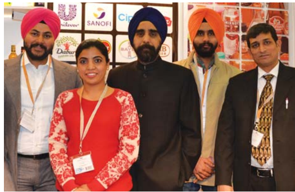
на стенде «S.S.P. Packaging industries»