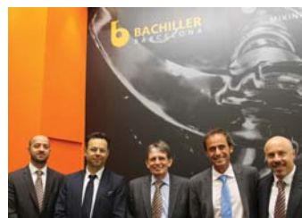
Команда компании «BACHILLER» Барселона, Испания