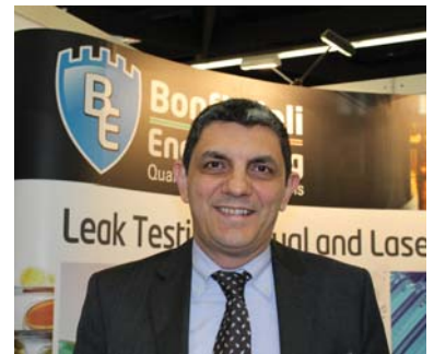
П. Меззетти, «Bonfiglioli Engineering»