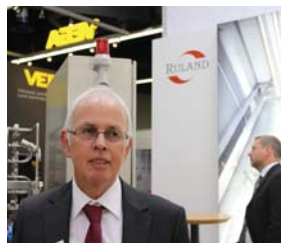
В. Зэх, «Ruland»