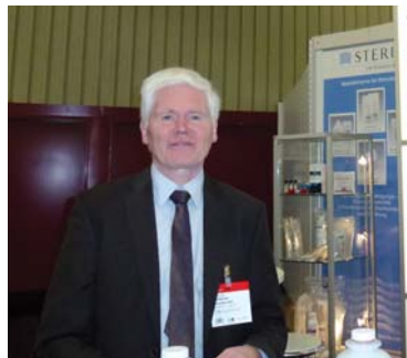
Г. Лауф, «Steris»

На выставке было распространено более 200 экземпляров нашего журнала.