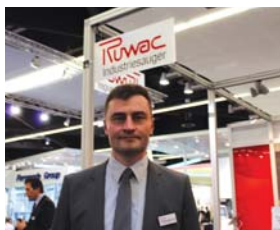
Э. Пробст, «Ruwac»

Среди них Роммелаг (технология выдува – наполнения – запайки для асептических растворов), Glatt (оборудование для гранулирования, нанесения покрытий, сушки), Festo (пневматические и электромеханические системы для автоматизации производства), Gemue (клапаны для стерильных процессов), Dockweiler (трубы и трубопроводная арматура), Stilmas (оборудование для водоподготовки), Pharmaplan (инжиниринг и консалтинг), Mueller (бочки и емкостное оборудование), SKAN (швейцарский лидер изоляторных технологий), Vausch (фармацевтическая упаковка для шприцев, картриджей, ампул), Belimed (очистка, дезинфекция и стерилизация), GEA (технологии прессования таблеток), Bosch (упаковочное оборудование высшего технологического уровня для жидких и твердых лекарственных форм), GIG Karasek (сосуды под давле-