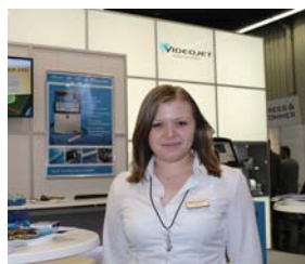
А. Вальтер, «VIDEOJET»