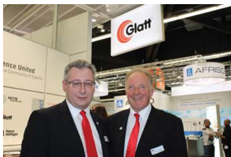
Л. Хайнцль и Р. Бёбер, «Glatt»

TechnoPharm, интернациональный форум для проектировщиков и операторов