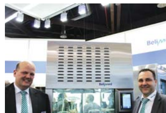
М. Вочтер, Н. Гахлер, «Belimed»