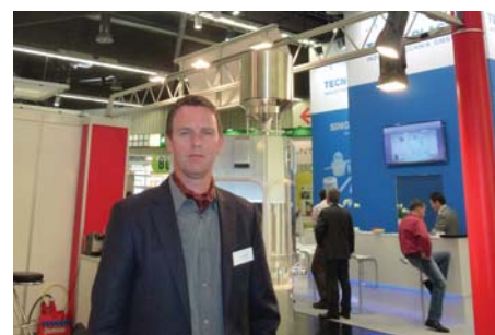
И. Краусе, «KG-PHARMA»