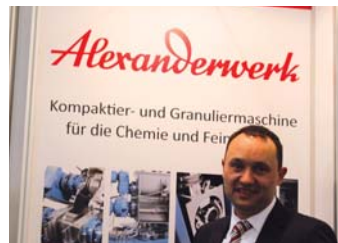
Д. Нейбх, «Alexanderwerk»