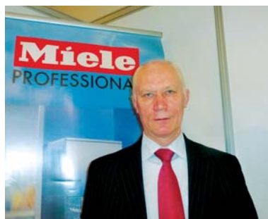
В. Тарасов, «Miele»