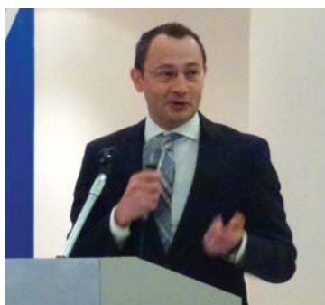
О. Аллес, «Мессе Франкфурт РУС»

На конференциях работали корреспонденты журнала «Медицинский бизнес».