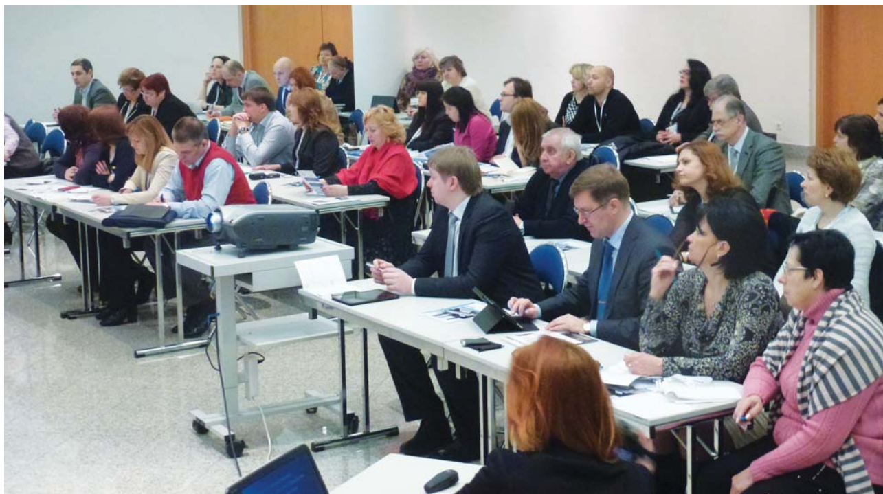
Фото и текст Н. Федисевой и Е. Чурсиной.

На конференции было распространено более 100 журналов «Медицинский бизнес»