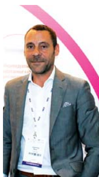
К. Гуссенс, «Capsugel»