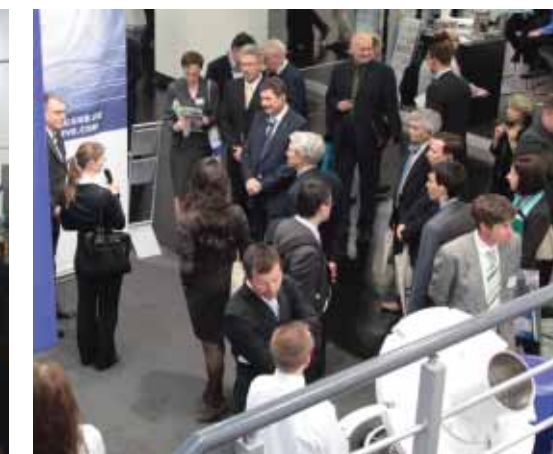
Делегация Татарстана на стенде Hosokawa Micron Group