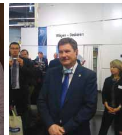
Р.Зарипов, министр промышленности и торговли Татарстана